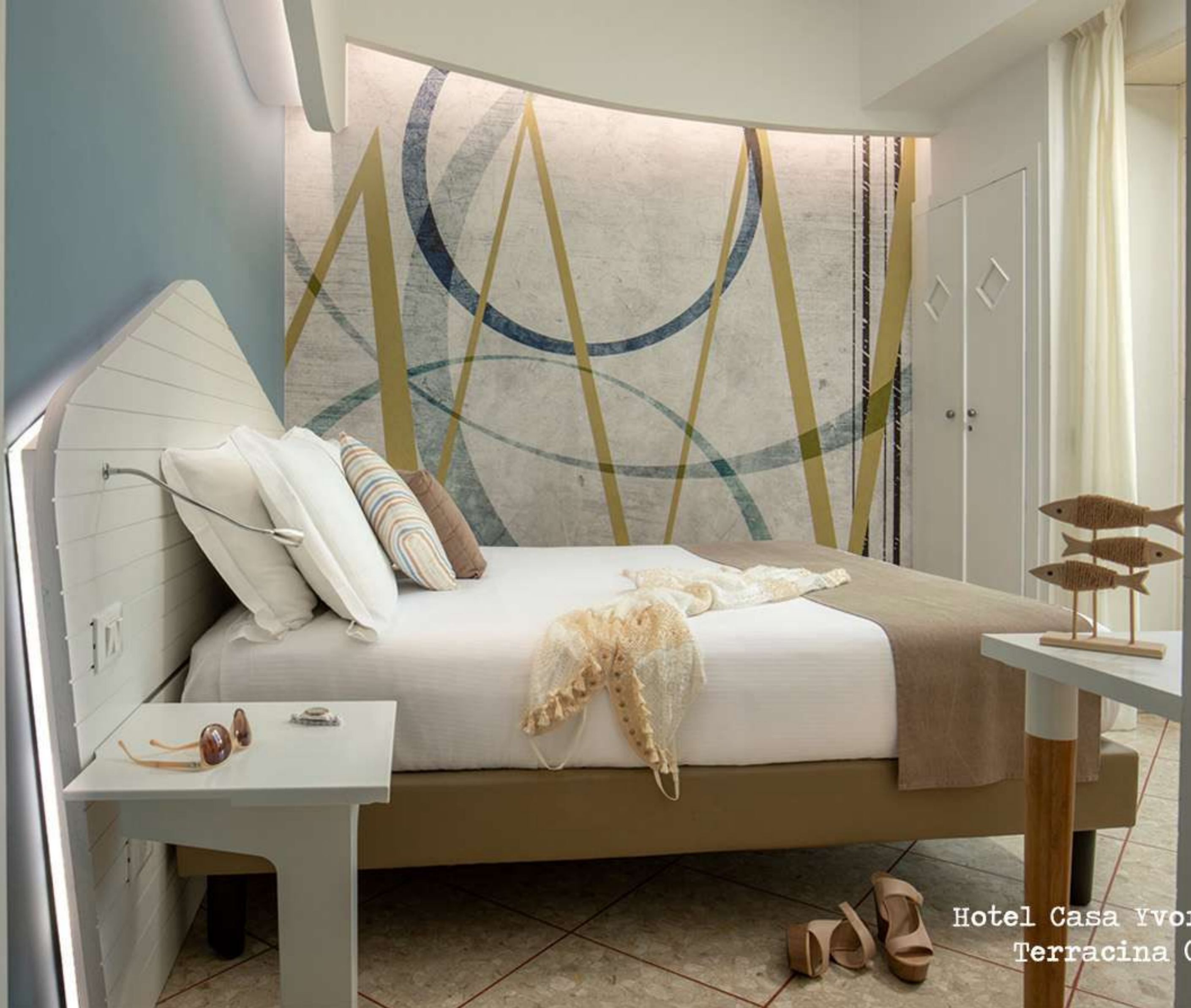
Hotel Casa Yvorio Terracina (LT)