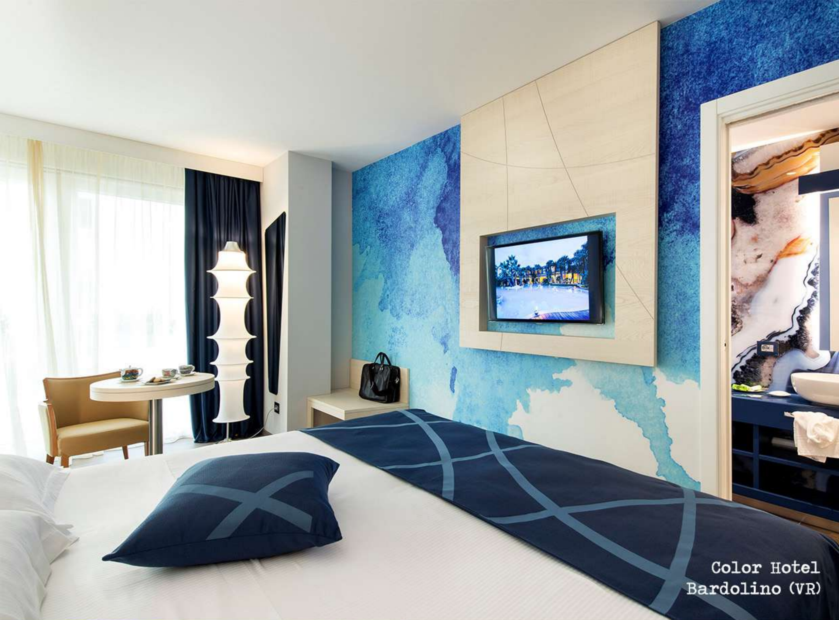
Color Hotel Bardolino (VR)