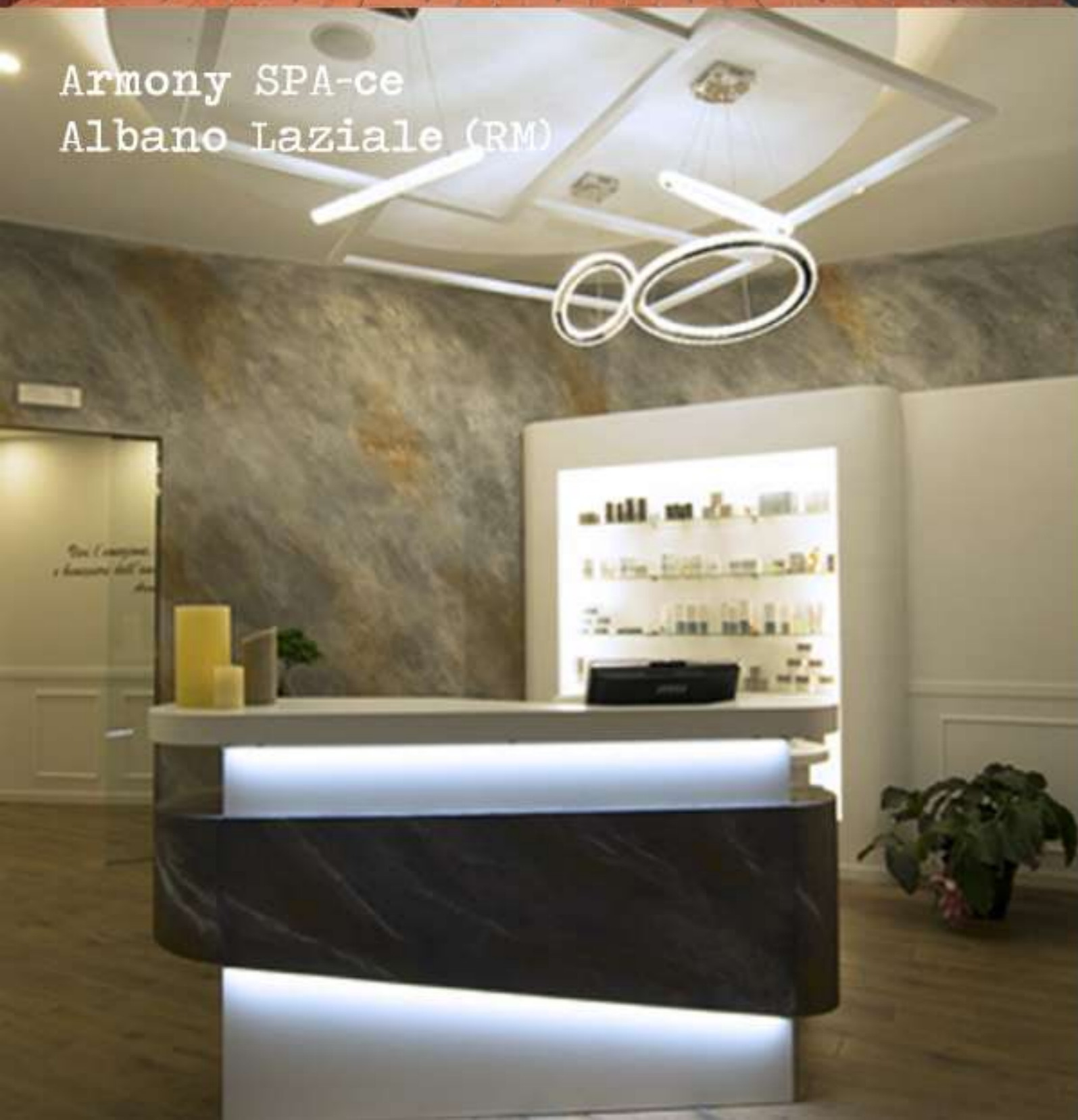
Armony SPA-ce Albano Laziale (RM)

Color Hotel - Bardolino (VR) Progetto di riqualificazione completo per fasi In corso