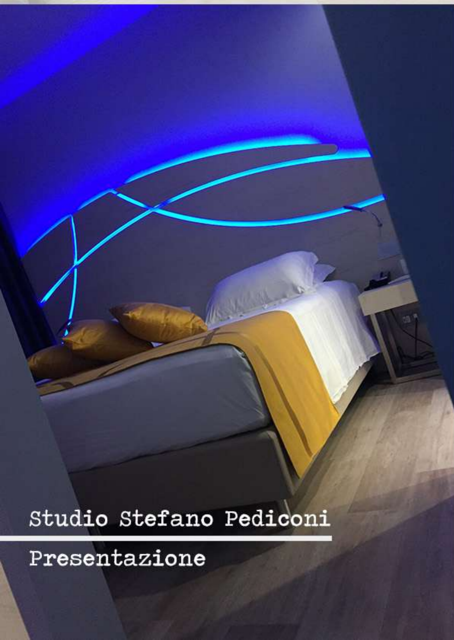
Studio Stefano Pediconi Presentazione