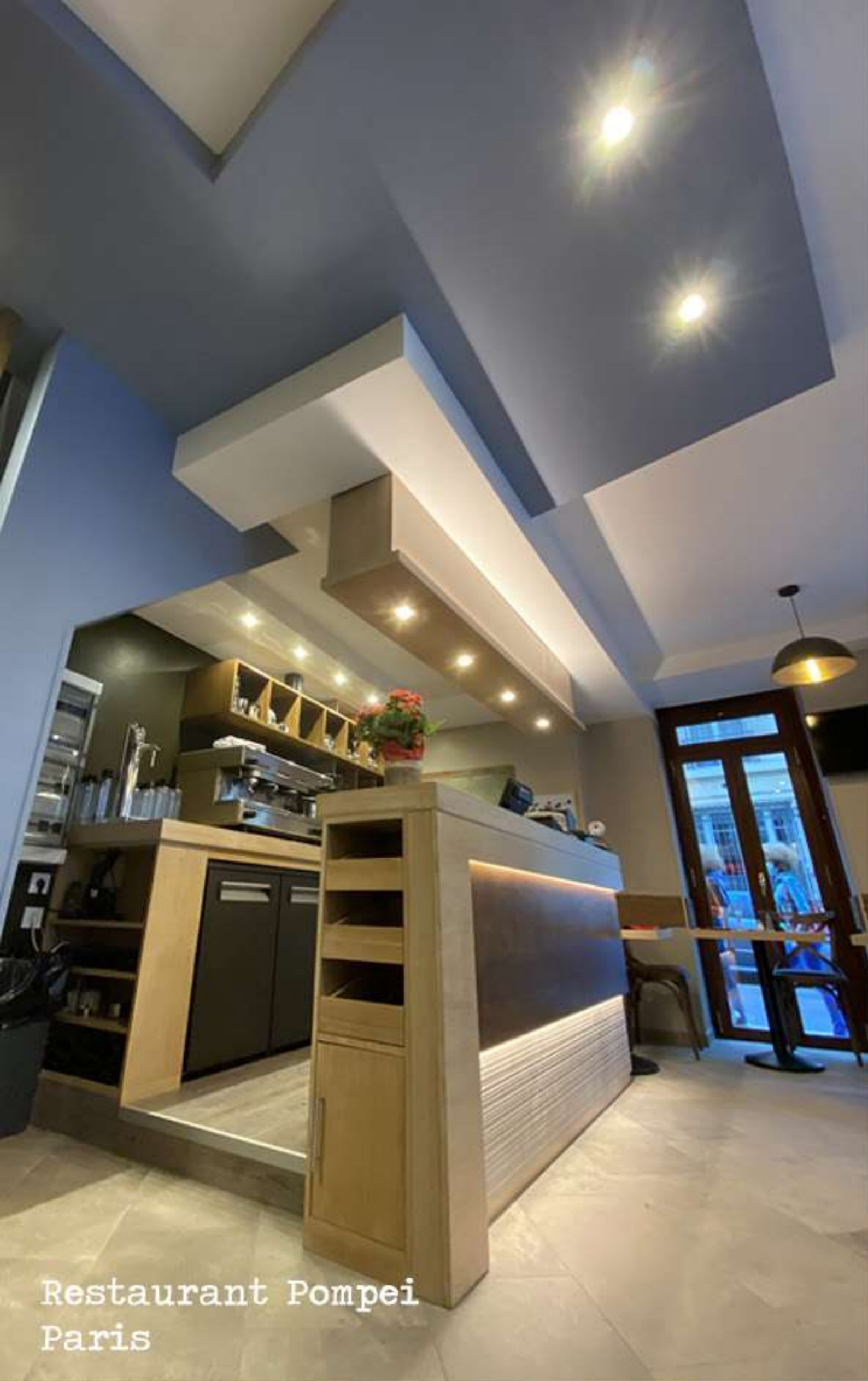
Restaurant Pompei Paris

Appartamenti Rue St. Honoré, Rue Réaumur, Rue Daval, Boulevard Bonne Nouvelle Avenue Mozart., Rue du Laos Boulevard Gambetta (Nizza)