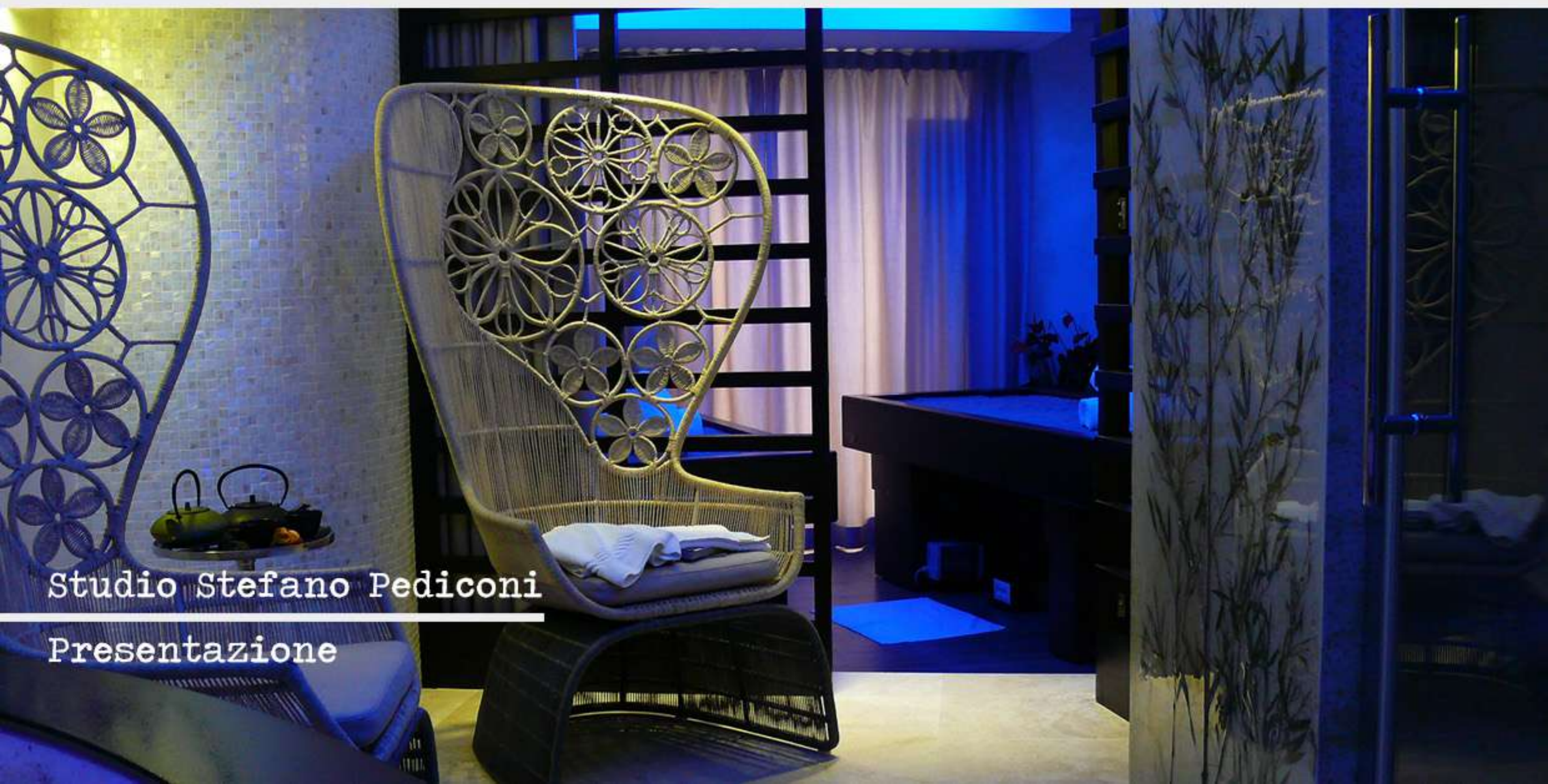
Studio Stefano Pediconi Presentazione

Un approfondimento che parte dalla valorizzazione dell'unicità della struttura attraverso il concept, la traduce in spazi e servizi e la presenta con immagini e storytelling.