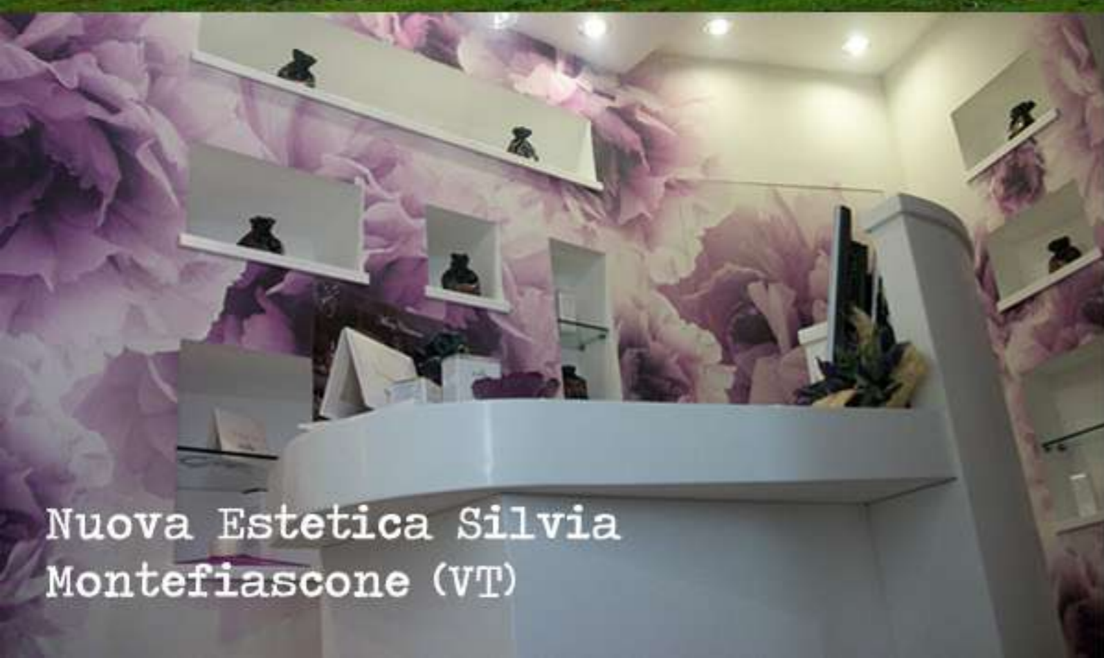
Nuova Estetica Silvia Montefiascone (VT)

Centri estetici "evoluti" Beauty Nicol - Montecchio Emilia (RE) Esthé - Fontenuova (RM) Nuova Estetica Silvia - Montefiascone (VT) Estetica Curesté - Vicenza Max Beauty - Viterbo