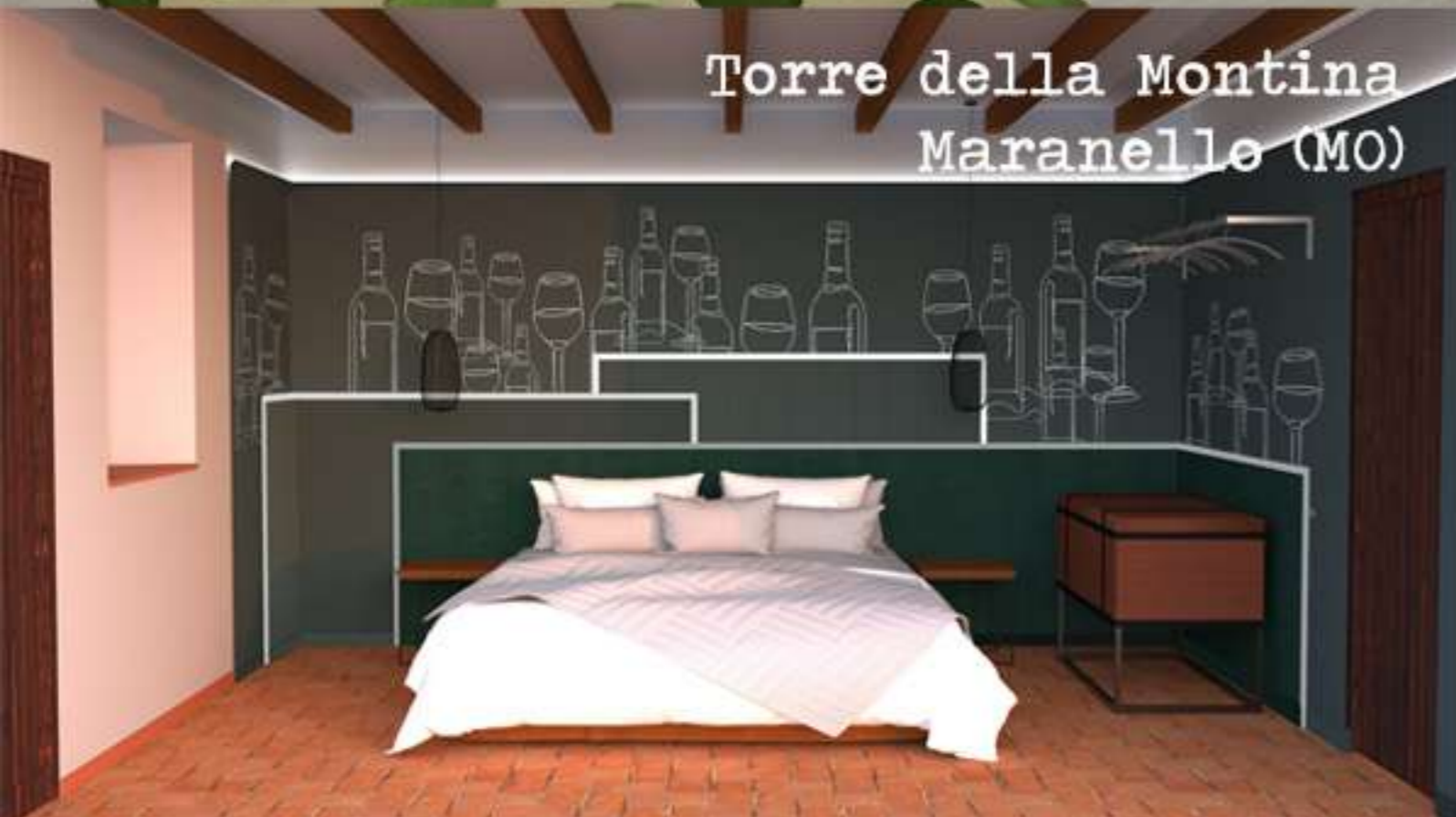
Torre della Montina Maranello (MO)