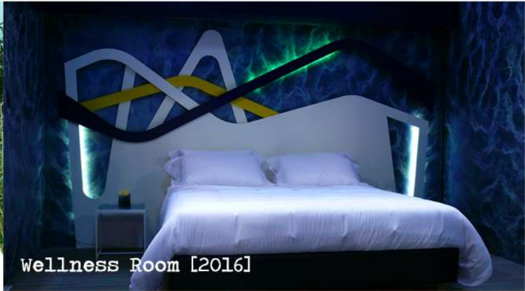
Wellness Room [2016]