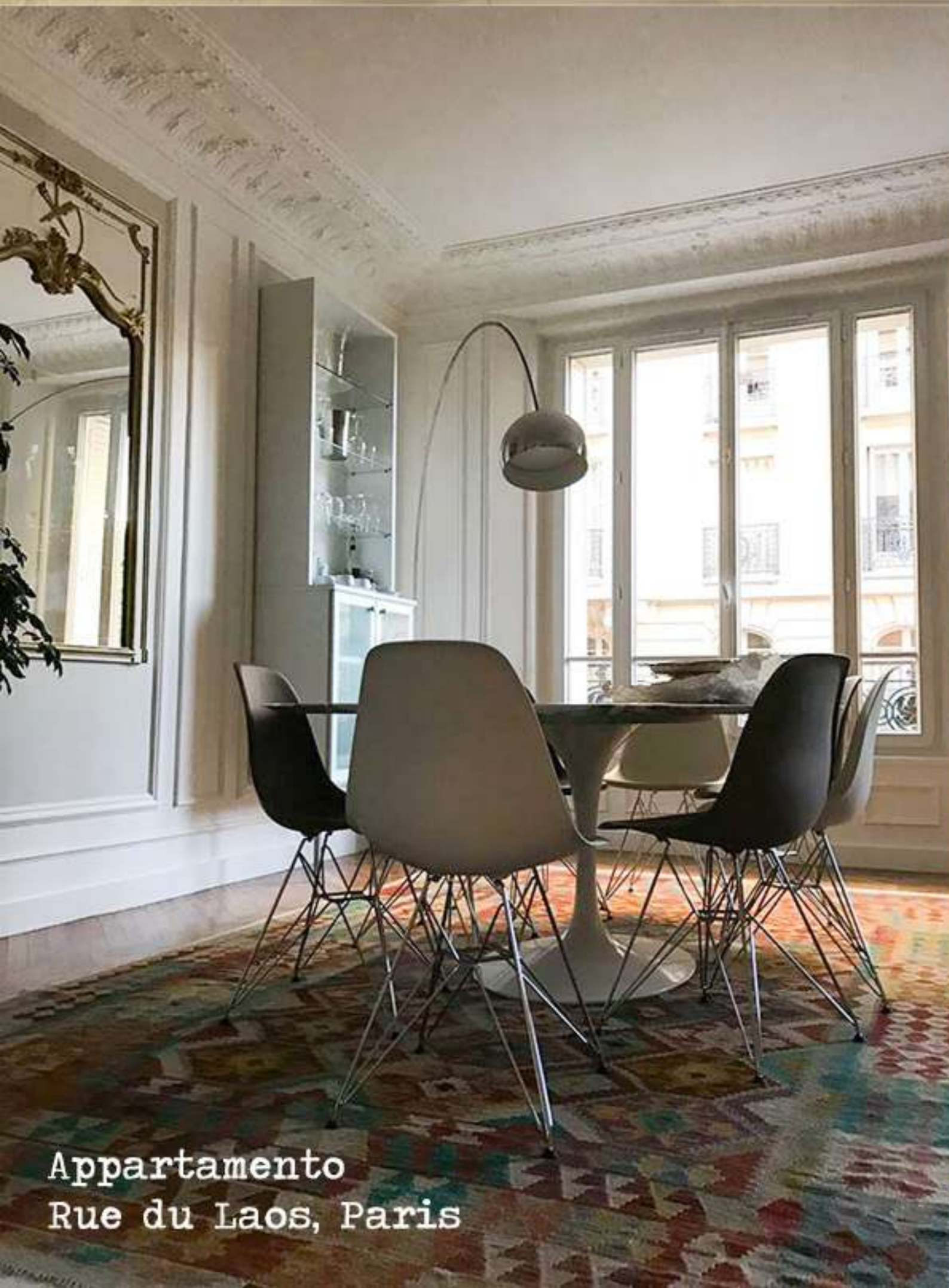
Appartamento Rue du Laos, Paris