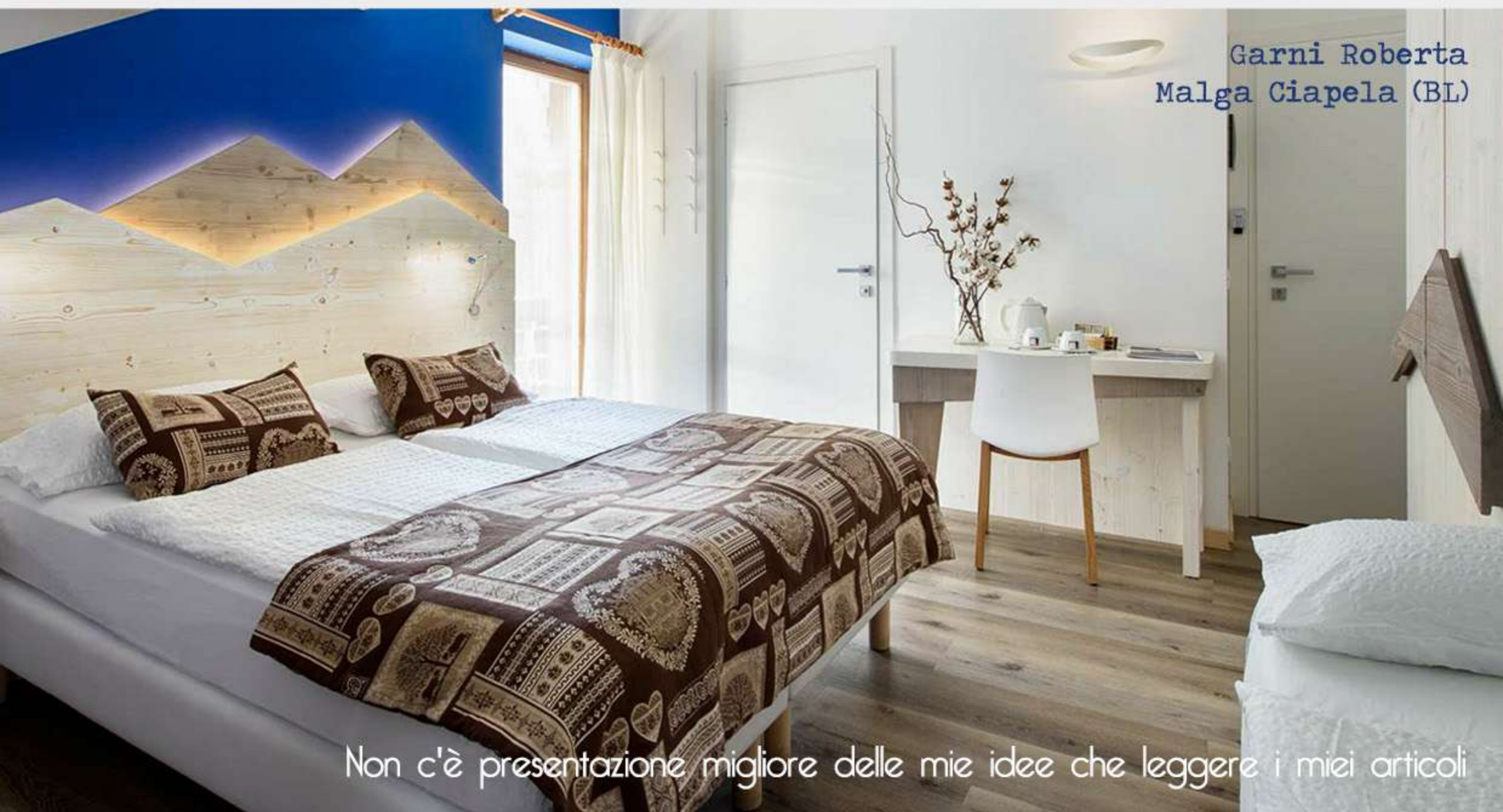
Garni Roberta Malga Ciapela (BL)

Oltre a quelli scritti sul blog, ho pubblicato articoli su riviste e portali web come Wellness Design, Sharing Tourism, Turismo d'Italia, Beauty Forum, Beyond The Magazine, Beauty & Money, Info Hotel ed altri.