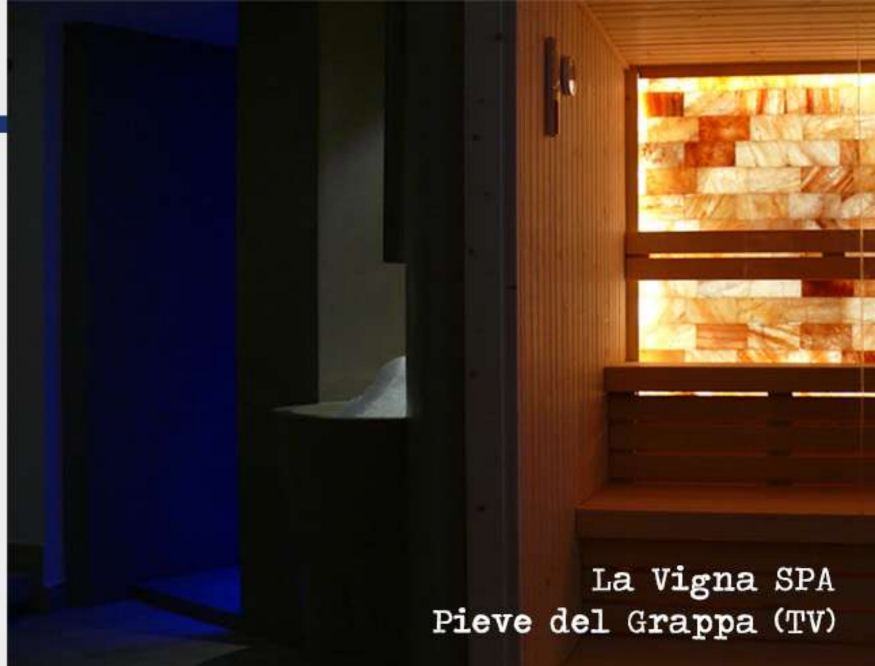
La Vigna SPA Pieve del Grappa (TV)