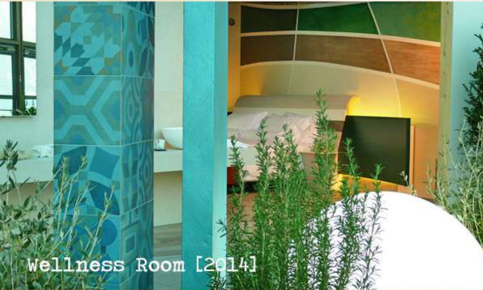
Wellness Room [2014]