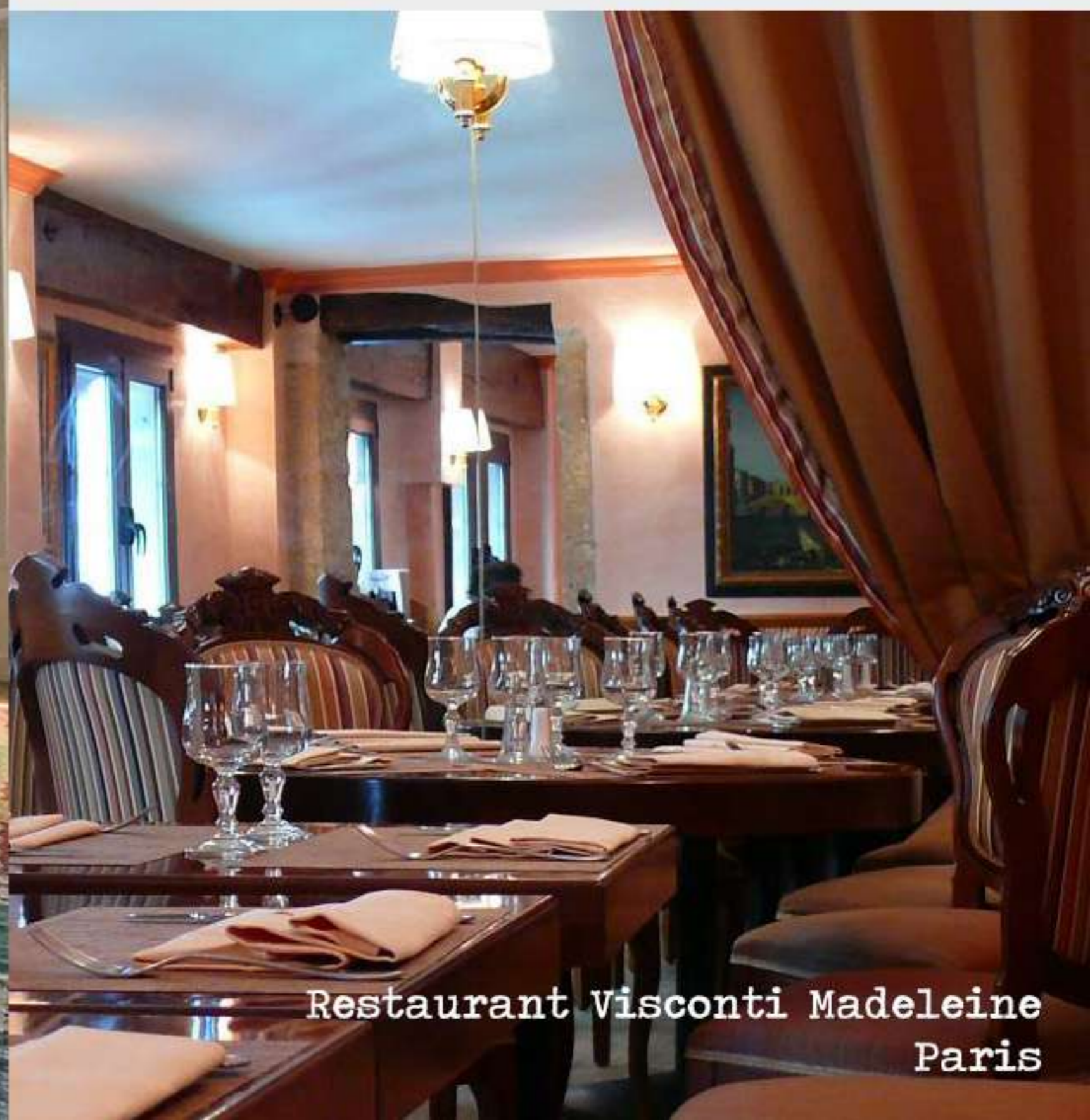
Restaurant Visconti Madeleine Paris