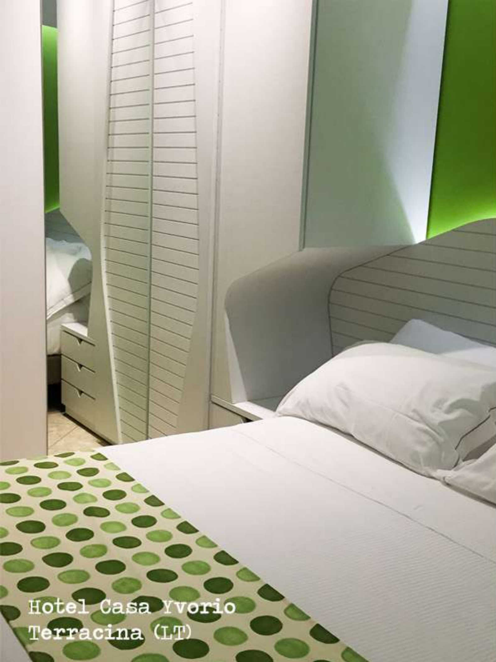
Hotel Casa Yvorio Terracina (LT)