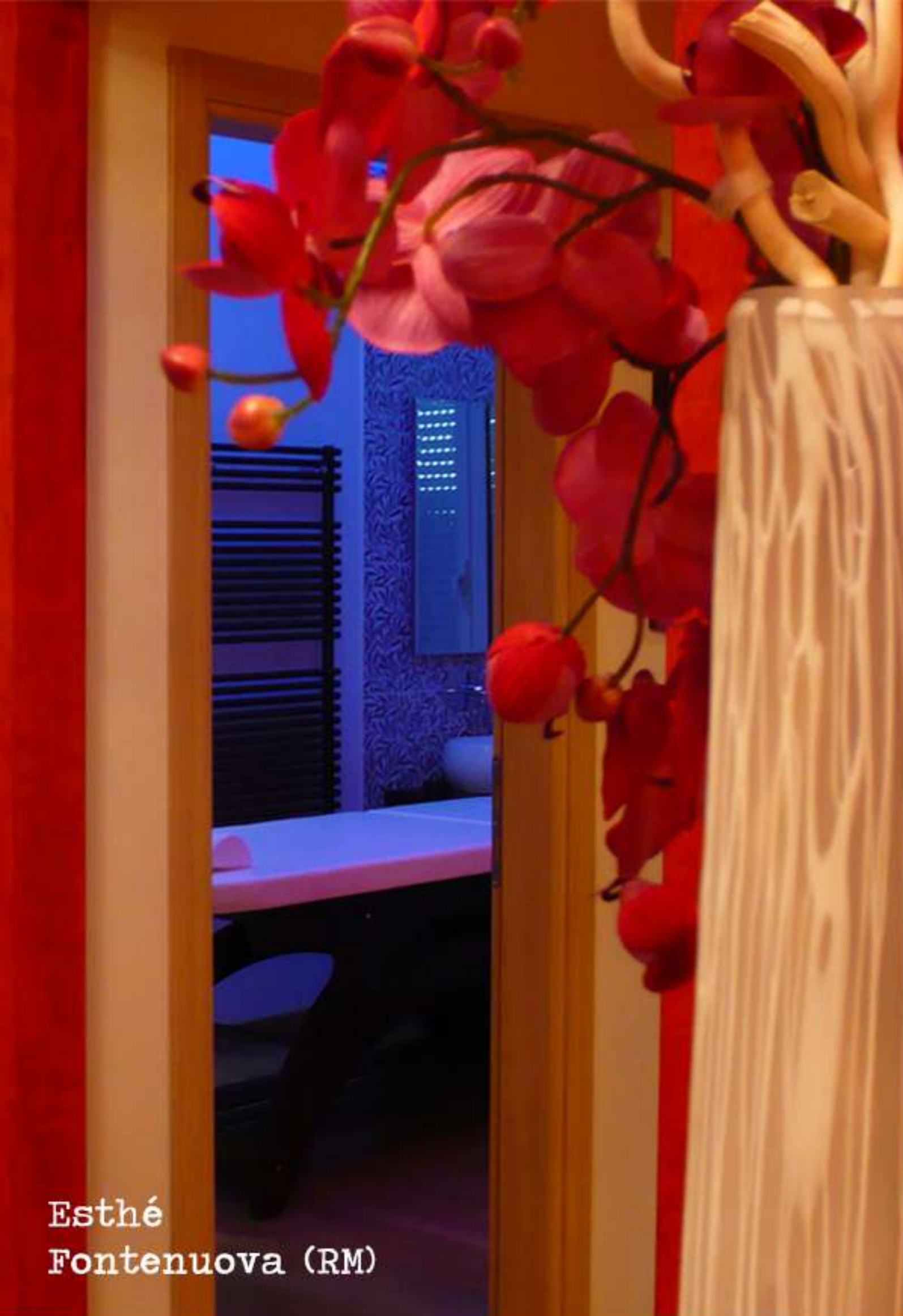
Esthé Fontenuova (RM)

Gadhafi Tower - Dakar (Senegal) Studio di fattibilità centro benessere e hotel 5***** e studio dell'interior design