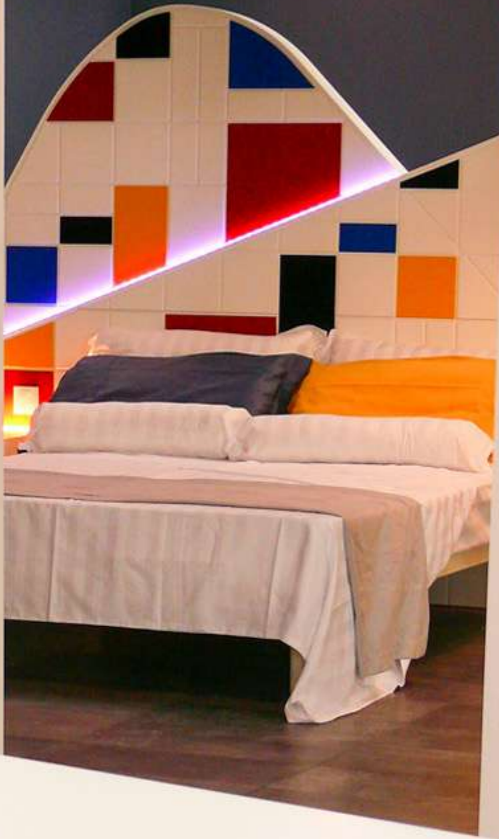
Wellness Room [2017]

Benessere e moda, anche in ambito privato