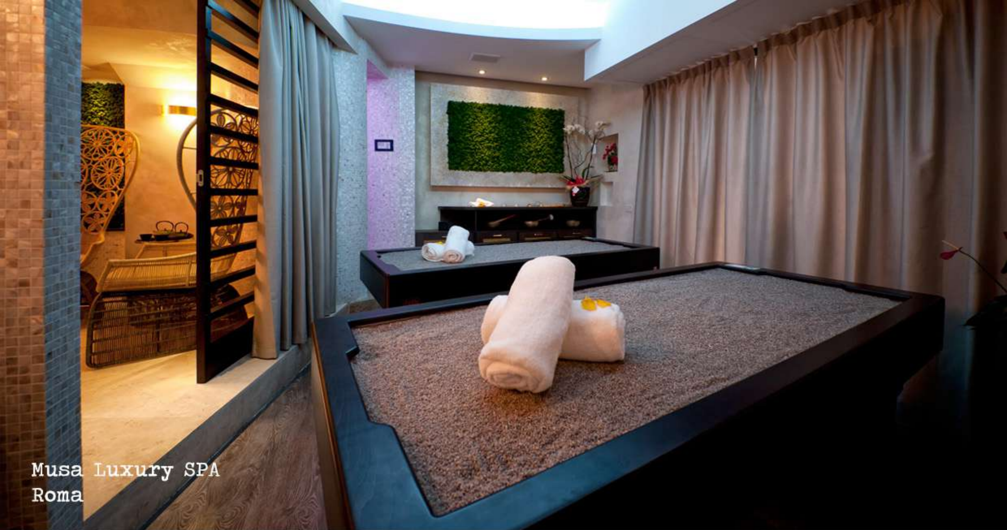
Musa Luxury SPA Roma